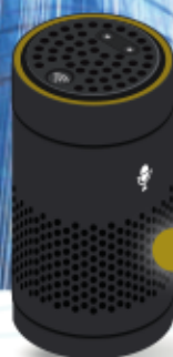
Assistente vocale digitale