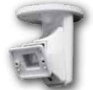
Hub-P / Hub-CP